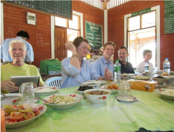
Honoratioren-Lunch at M&M High School