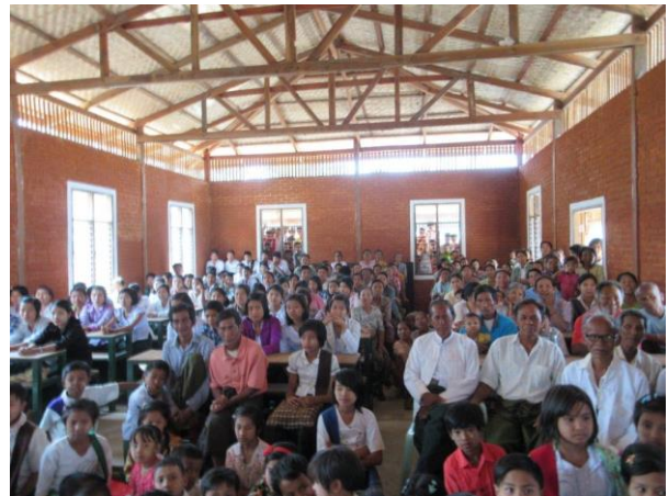
Ceremony in der neuen Aula