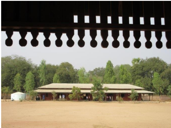
Martin&Manuel School I

Am 25.02.2016 genau zwei Jahre und einen Tag nach dem pompösen School Opening der „Martin&Manuel High School“ in Taung Taw, brechen wir von Bagan/Nyaung U wieder auf, um den Erweiterungsbau einzuweihen. Alle Teilnehmer sind schon gespannt, was für Veränderungen wir antreffen werden und wie der Schulbetrieb sich in den letzten beiden Jahren entwickelt hat. Zu Beginn waren es nur rund 200 Schüler, aktuell sind es jetzt schon 488 Schüler und Studenten, wir sind darauf etwas stolz.