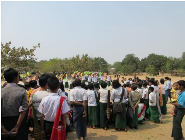
Empfang mit Tanzvorführung

„ Mingalaba “: Der Bürgermeister, die neue Schul-Leiterin, alle Lehrer und 488 Schüler begrüßen uns herzlich.