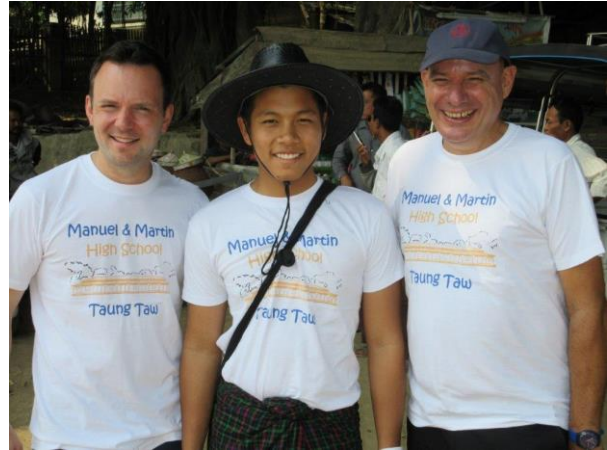
High School "Boys"

folge wie vor zwei Jahren: Wieder sitzen wir, fliegenverscheuchend umfächert von jungen Schülerinnen, bewacht unter den nicht abschweifenden Augen der Schuldirektorin und kritisch beäugt von Dutzenden von dunklen Kinderäugen, die zu den Fenstern des Klassenraums von draußen hinein spechten.