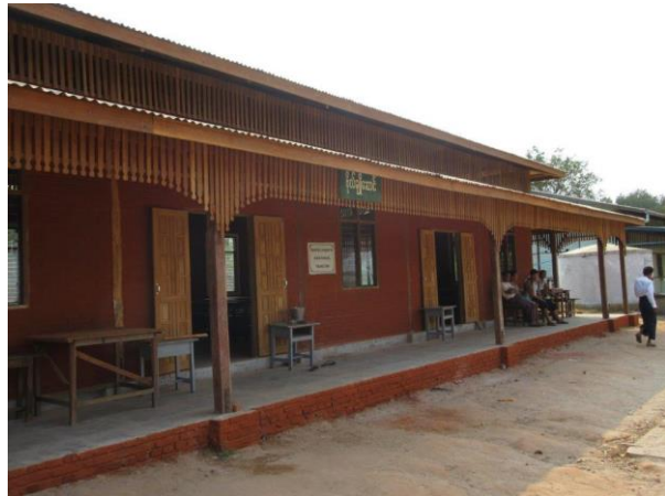
Manuel&Martin High School II

Zur großen Überraschung für uns gibt es inzwischen eine neue Straße, die ungeteert direkt ins Village Taung Taw führt; so bleibt uns die „Ochsentour“ am Ende der Anreise erspart. Auf dem Campus herrscht reger Betrieb, vormittags sind noch Examensprüfungen abgehalten worden, und letzte Vorbereitungen für die Feier werden getroffen: Die angereisten Gäste werden gebeten, sich noch 15 Minuten die Füße zu vertreten.